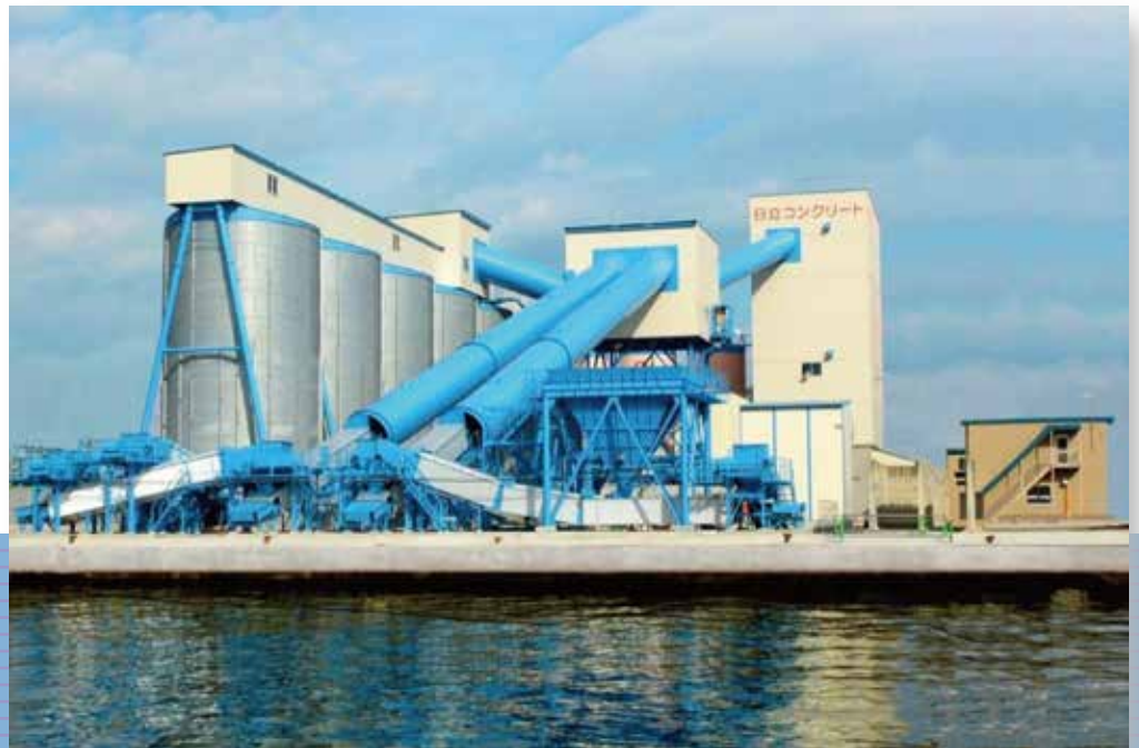
日立コンクリート(株) 新砂工場

当社は、生コンクリートおよびセメント加工品の販売を中心とした事業活動により、環境に優しく、高い強度を持つ安全な建築のサポートを行っております。また、お客様ニーズにいち早く応えるため、グループ会社との連携による迅速な納入システムを確立し、すぐれた製品を迅速にお届けすることで、現場作業の効率をアップさせています。今後も、今まで培ってきたノウハウときめ細かな対応を心がけることで、より良い環境づくりに貢献していきたいと考えています。