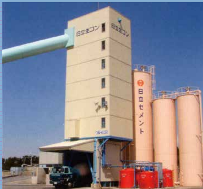
(株)日立生コン 日立工場