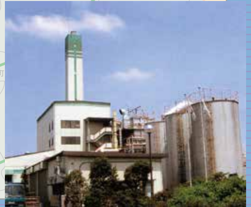
日立セメント(株)神立資源リサイクルセンター